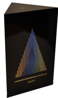
Caja de 1 botella - Vitral de Otazu 2015

Cromointerferencia Otazu es una obra que escapa a cualquier clasificación, que además se fundamenta en la historia y esencia del terroir de Otazu con una perspectiva vanguardista. “Aquí no hay mensaje que descifrar, sino una situación a experimentar, es un descubrimiento, un complejo de descarga perceptual y sensorial que pondrá en juego las sensaciones primarias”. Con estas palabras definió el reconocido artista venezolano del arte cinético-óptico el proyecto con Bodega Otazu, una magna obra de arte que significa para Carlos Cruz-Diez “una aventura en el tiempo y el futuro”, que comenzó en el diálogo íntimo de este creador con la Bodega durante su visita a la misma. El sello de Cruz-Diez también late en el corazón de la Bodega a través de su obra Ambientación de cromosaturación Otazu (2018) que creó para su Catedral del Vino , donde reposan las barricas de la Bodega y el vino se mece con los suaves sonidos de los cantos gregorianos.