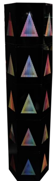
Propuesta de montaje cajas de 1 botella – Vitral de Otazu 2013-2042

Carlos Cruz-Diez ha escogido adaptar Cromointerferencia (1964) para el empaque de Vitral de Otazu. El resultado es una serie de diferentes armonías de colores por cada añada, especialmente diseñadas para este proyecto en colaboración con Bodega Otazu. Las Cromointerferencias de Cruz-Diez se componen de dos capas: una secuencia de líneas paralelas de colores acomodadas verticalmente como capa base, y un patrón de líneas negras que crea la interferencia sobrepuesta. El movimiento creado por el patrón superpuesto produce un efecto de volumen que provoca que los colores de los módulos se iluminen y cambien. Según, comentó en su día, Cruz-Diez, este trabajo es un “prisma falso”, ya que reproduce los colores en el espectro de luz mediante el uso de la segunda capa de líneas negras.